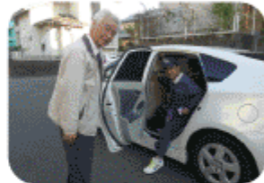
ご自宅の玄関まで付き添います。

“まさか自分がお世話になるとは思わなかったが、今は「ふれあい南が丘」がないと非常に困ります。予定日以外でも臨機応変に対応してもらい大変助かります。” 「ふれあい南が丘」の活動は、地域をつなぐ大切な活動になっています。