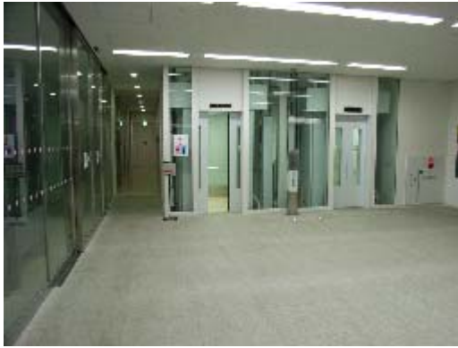
正面入口って左手电エレベーター