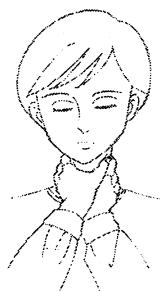
扼頸（手や腕で首をしめる）